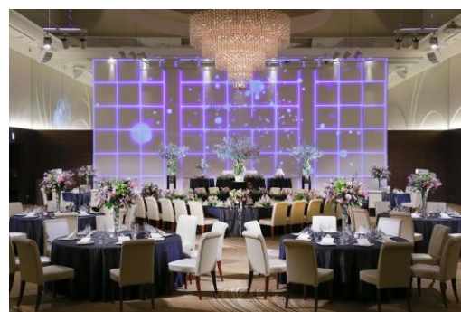
メインバンケットホール「鳳翔」

『御宿東鳳』は、従来の老舗温泉旅館の魅力はそのままに、食と温泉に加え、婚礼においても新たな魅力を創造し、地域一番館として、より一層多くのお客さまに愛される旅館へと進化を続けながら、旅先での至福と癒し、新しい感動をご提供してまいります。