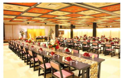
和式大宴会場「芙蓉」

「芙蓉」の花言葉である「繊細な美」「しとやかさ」を表現する色使いと、「芙蓉」の花を想起させる「親しみ・優雅さ・華やかさ」を表すデザインをあしらひ、床面を総琉球畳に変更しました。ご宴会だけでなく、和婚にもご利用いただける趣ある空間に改装しました。