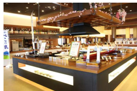
バイキングレストラン「あがらんしょ」

中宴会場および客室 39 室を中心に、本館の全館リニューアルを行いました。清潔感あふれる空間を提供し、より快適にお過ごしいただけます。