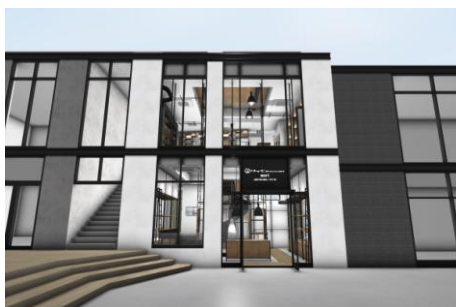
《MSPC PRODUCT sort》