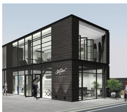
《WTW SURF CLUB》