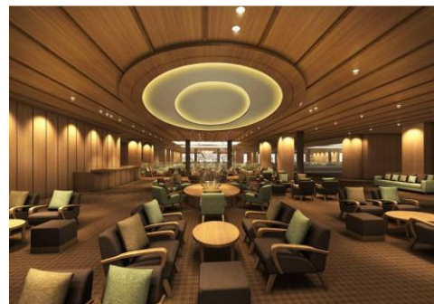
「ロビーラウンジ」イメージ

(*)じゃらん net 総合クチコミ集計による(2014 年 1 月～12 月)