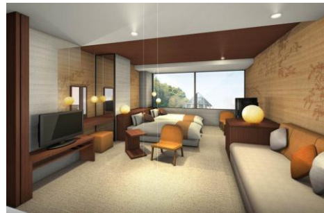
「ブライズルーム」イメージ

既存の和室を改装し、ブライズルーム 2 室を新設しました。婚礼当日の準備やお色直し時の控え室としての利用をはじめ、婚礼後には、新郎・新婦でゆっくりとご宿泊いただけます。