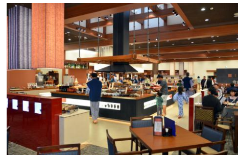
バイキングレストラン「あがらんしょ」

中宴会場および客室 39 室を中心に、本館の全館リニューアルを行います。清潔感あふれる空間を提供し、より快適にお過ごしいただけます。