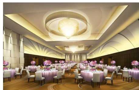
メインバンケットホール「鳳翔」イメージ

メインバンケットホールの名前の由来である「鳳凰」が飛び立つイメージをコンセプトに、「鳳凰」の羽をモチーフにした勢いが感じられるデザインを壁面とカーペットに採用しながらも、会津の伝統と格式を感じられる空間へと刷新。また、会津エリアで初の3Dプロジェクションマッピングなどの新照明・映像システムを導入し、バンケットルームの壁面に映像を投影することで、ダイナミックな動きのある演出が可能になりました。