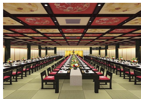
和式大宴会場「芙蓉」イメージ

「芙蓉」の花言葉である「繊細な美」「しとやかさ」を表現する色使いと、「芙蓉」の花を想起させる「親しみ・優雅さ・華やかさ」を表すデザインをあしらい、床面を総琉球畳に変更しました。ご宴会だけでなく、和婚にもご利用いただける趣ある空間に改装しました。