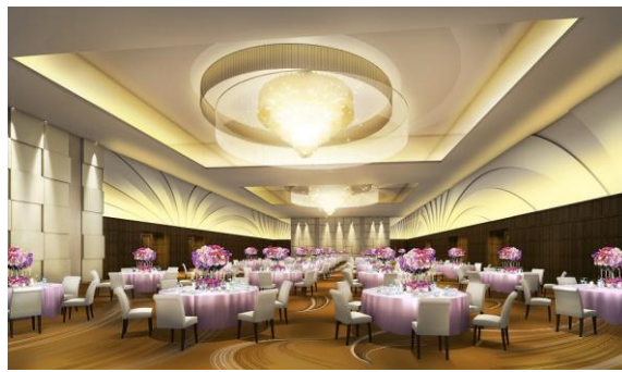
メインバンケットホール「鳳翔」イメージ

『御宿東鳳』は、従来の老舗温泉旅館の魅力はそのままに、食と温泉に加え、婚礼においても新たな魅力を創造し、地域一番館として、より一層多くのお客さまに愛される旅館へと進化を続けながら、旅先での至福と癒し、新しい感動をご提供してまいります。