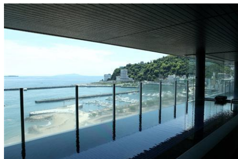
大展望露天風呂（男性用）