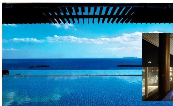
大展望露天風呂からの眺望

お得にお楽しみいただける『温泉パスポート』を利用いただき、「ホテル ミクラス」のオーシャンビューの大展望露天風呂を、ぜひ堪能してください。