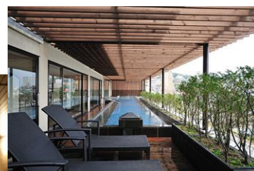
女性用大展望露天風呂