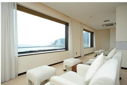
女性専用リラクゼーションラウンジ