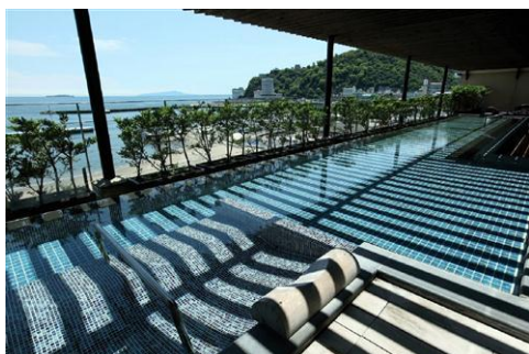
大展望露天風呂（女性用）