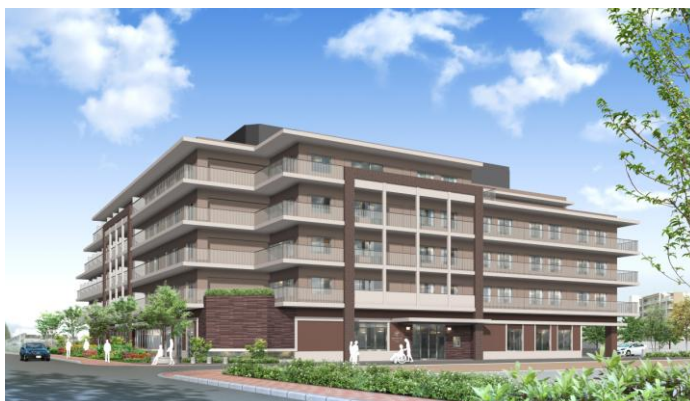
外観イメージ 土地・建物 : 賃借

開設時期 : 2015 年 3 月(予定) 管理会社 : 株式会社コープリビングサービス 居室面積 : 26.2m 2 総戸数 : 59 戸 主な設備 : 風呂、浴室乾燥機、トイレ、洗浄機付便座、独立洗面化粧台、室内洗濯機置き 場、IH 2 口コンロ、カラーモニター付インターホン、クローゼット、シューズケース 共用設備等 : オートロック、エレベーター、防犯モニター、防犯カメラ、自転車置き場、宅配ボ ックス、インターネット無料、防災備蓄倉庫完備、コミュニティーラウンジ