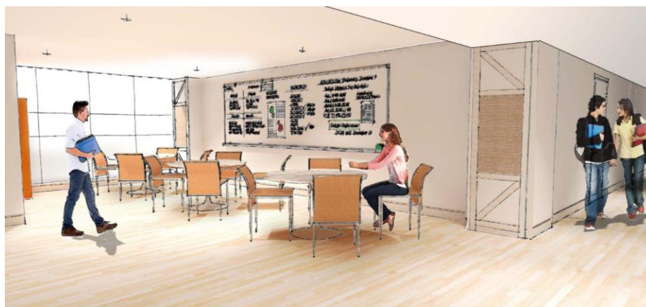
コミュニティーラウンジ(イメージ)