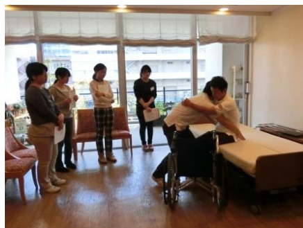
インターンシップ(介護体験)の様子