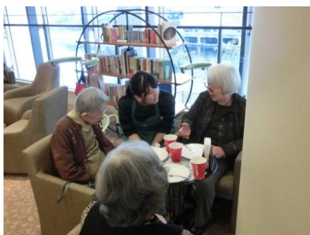
インターンシップ(アクティビティ補助)の様子