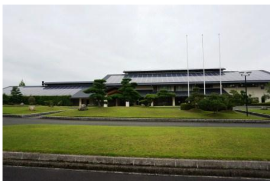
▲ クラブハウス正面