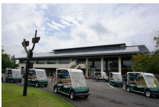
▲ クラブハウス (スタートテラス側)