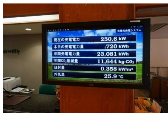
▲ ソーラー発電測定表示モニター (フロント横)