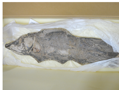
シーラカンスの仲間（アクセルロディクチス）

（※）硬骨魚類…骨格の大部分が硬骨で出来ており、浮袋があることなどが特徴で魚類の約90%以上を占める