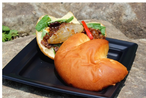
男性も満足のボリュームたっぷりの一品です。

ハーベストカフェでお馴染みのバーガーシリーズが、この夏「恐竜」バージョンに大変身。「恐竜」の足型をした、やわらかなバンズの中に、京野菜の壬生菜と焼肉を挟みこみました。少しピリっとした四川風のタレがアクセントになり、ビールにも良く合う、ボリュームもたっぷりの一品です。