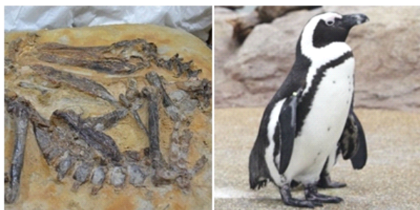
(左図)ペンギンの化石