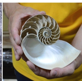
（右図）オウムガイの殻