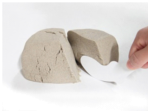
固まった砂も厚紙でサクッと切ることができます。