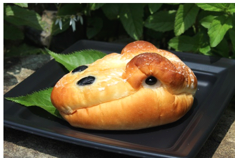
パンによって表情の違いもお楽しみいただけます。

販売期間：2014年7月19日(土)～9月24日(水) 販売場所：かいじゅうカフェ