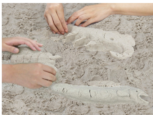
新感覚の砂で、古代のいきものを作ってみよう。

「交流プラザ」では、新感覚の砂「キネティックサンド」の砂場が国内最大規模(約7m×約2.5m)で登場します。「キネティックサンド」は、指や手に張り付かずに粘土のような感覚で自由に造形が楽しめるため、「古代の海のいきもの」や「魚を食べる恐竜」などを想像しながら、砂で好きな形のいきものを作っていただけます。お子さまから大人まで、初めて体験する砂の感触を楽しみながら、古代の海に思いを馳せてみてはいかがでしょうか。