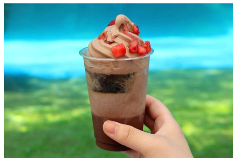
食べるほどに「地層」の味が変化していきます。

「地層」をイメージした甘さ控えめのチョコレートパフェです。チョコレートプリンとコーヒーゼリーで三層の地層を形成し、頂上のソフトクリームから滴るストロベリーソースで、火山が噴火した様子を再現しています。食べていると中から、化石に見立てた「ナッツ」が登場。ナッツを探す楽しさと、サクサクとした食感を同時にお楽しみいただけます。