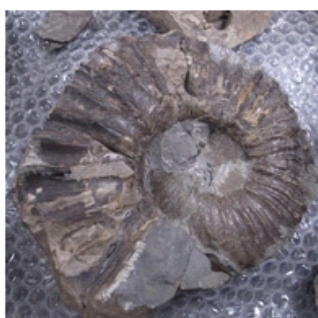
（左図）アンモナイトの化石

きれいならせん状に巻いた殻が特徴の、古代生物「アンモナイト」と、「アンモナイト」にそっくりな現存の「オウムガイ」との違いについて学べるコーナーです。外見だけではなかなかわかりませんが、殻の中にはどんな秘密がかくされているのか？これらが何の仲間なのか？などについて学べます。