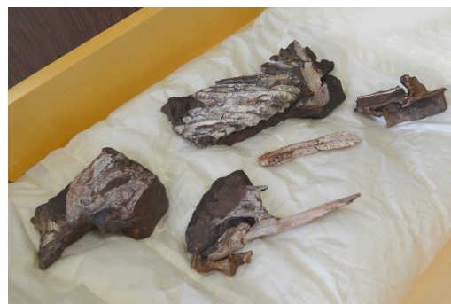
「イクチオステガ」の部分骨格

「恐竜」が誕生するより昔、現在から約3億年以上前にはじめて水中から陸で生活をするようになった、歴史上最も古い両生類のひとつが「イクチオステガ」です。その姿に似た、生きた化石と呼ばれる世界最大の両生類「オオサンショウウオ」と「イクチオステガ」を比較し、いきものが生活の場所や形を変えていく過程を学べます。