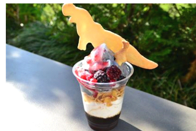
ペンギンもびっくり!? きょうりゅうパフェ

商品内容：ペンギンカフェの名物「ペンギンパフェ」と福井県立恐竜博物館の「ティラノパフェ」がコラボレーションしたパフェです。恐竜とペンギンのクッキーがのっています。