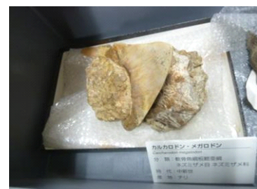
メガロドンの歯の化石標本

開催内容：実物の化石標本や福井県立恐竜博物館の研究員がピックアップした恐竜に関する書籍などを設置します。夏休みの自由研究にぴったりです。