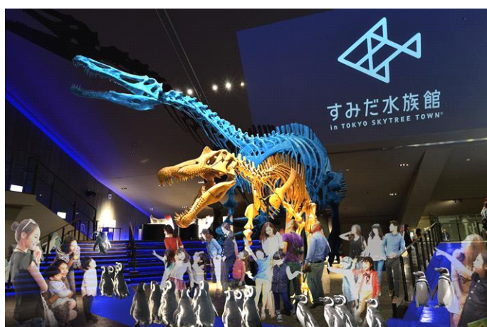
（左）バリオニクス と（右）フクイサウルス ※イメージ画像

「きょうりゅうすいぞくかん」では、鳥類の祖先と推測される恐竜と、現存する鳥類であるペンギンとの違いや共通点を知っていただくことを目的に、『福井県立恐竜博物館』とコラボレーションし、恐竜の全身骨格の展示や体験プログラムを実施します。『すみだ水族館』の館内で、全長4.7メートルの同館を象徴する恐竜「フクイサウルス」や、全長約8.8メートルの「バリオニクス」などの全身骨格を原寸大で展示します。また、アンモナイトの化石や巨大サメ・メガロドンの歯の化石などの展示を行います。体験プログラム「恐竜ペーパークラフト」では、コラボレーションワークショップとして『福井県立恐竜博物館』がプロデュースした紙でできた「フクイサウルス」を組み立てるペーパークラフトづくりを実施します。