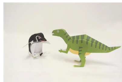
ペンギンと恐竜ペーパークラフト

開催日：2014年8月1日(金)～9月21日(日)の平日 開催時間：各日10時00分～17時00分(最終受付16時30分) 開催場所：5階 すみだステージ 参加定員：各日40名 参加対象：小学3年生以上 参加方法：当日申し込み 開催内容：『福井県立恐竜博物館』プロデュースのペーパークラフトワークショップを『すみだ水族館』で開催します。切り抜いて組み立てたら、自分だけのフクイサウルスが作れます。今回は、特別にペンギンのペーパークラフトとセットで作っていただけます。