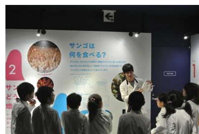
恐竜研究員のガイドツアー ※イメージ画像

開催日：2014年8月19日(火) 開催時間：〔子ども向け〕11時00分～12時00分 〔大人向け〕19時30分～20時30分 開催場所：館内各所 参加定員：各回20名 参加方法：事前募集 ※詳細は公式ホームページでお知らせします。 開催内容：福井県立恐竜博物館の研究員が、各種骨格標本を解説する特別なガイドツアーです。