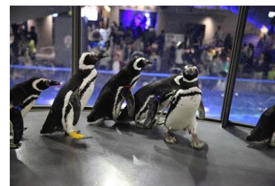
ハロー！ペンギン ～Penguin Meets Dinosaur～