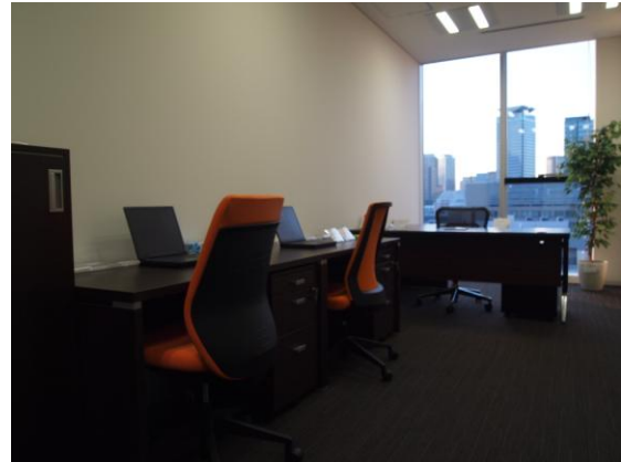
1201 号室(27.39 m 2 )