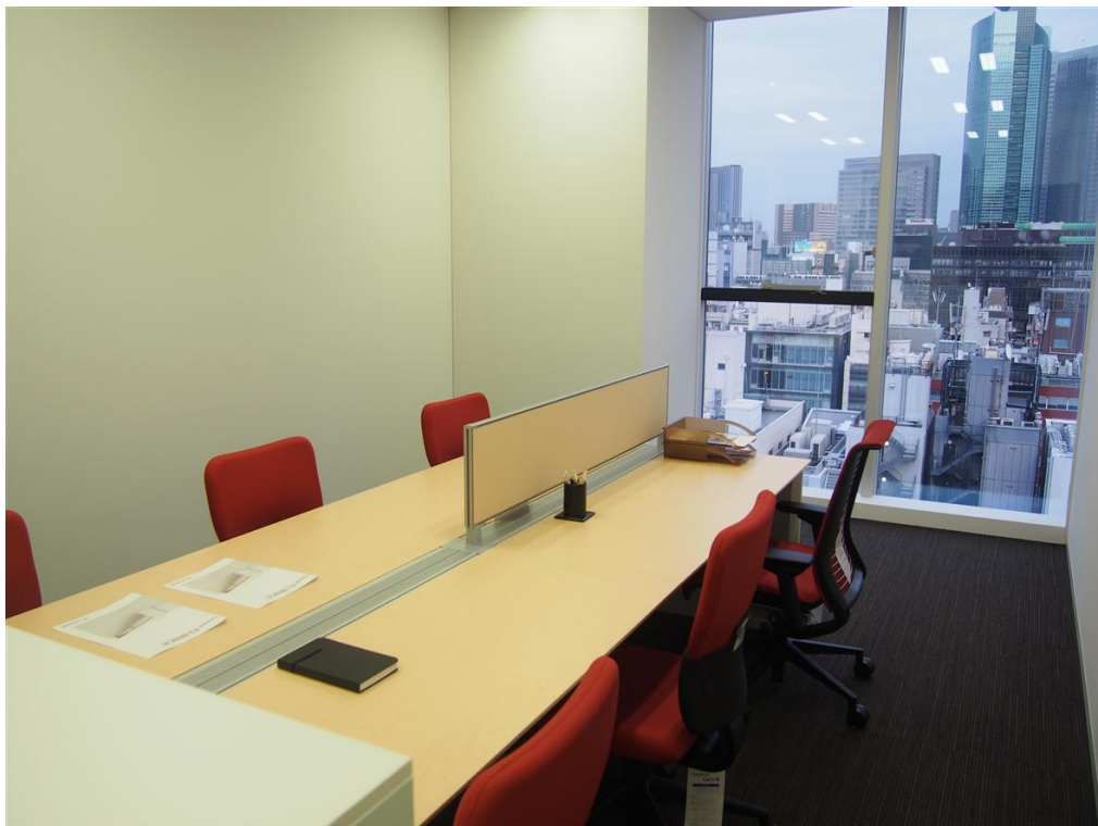
1407 号室(25.94 m 2 )