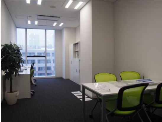
1001 号室(27.39 m 2 )