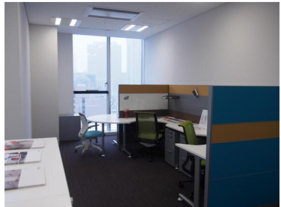
1403 号室(42.64 m 2 )