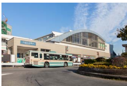
西武池袋線「ひばりヶ丘駅」

このように便利な立地にもかかわらず、東京都で唯一「平成の名水百選」に選ばれた「南沢湧水群」(徒歩14分)など豊かな自然環境にも恵まれています。