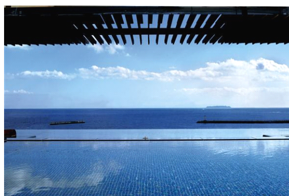
大浴場からの眺望