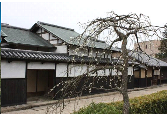
尾形光琳屋敷全景