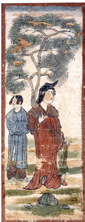
重要文化財 樹下美人図 (MOA美術館蔵)