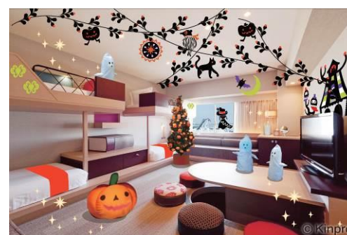
Kinpro とのコラボルーム「ハロウィーン Party ルーム」

窓からのぞく小さな魔女、みんなの Party に紛れ込むオバケたち、天井から吊り下がるジャック・オ・ランタンが皆さまのパーティーをさらに盛り上げます。