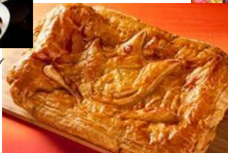
ホテルのロゴ入り おばけが作った？ パイ包み焼き