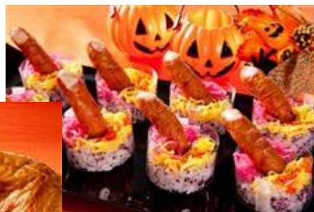
魔女のいたずら!?フィンガーSUSHI