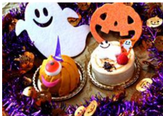
左:パンプキンモンスターケーキ 400円(税込み) 右:ゴーストキャラメルムース 450円(税込み)