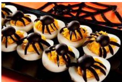
スパイダー・スパイダー！スタッフドエッグ