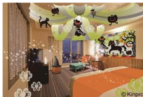
Kinpro とのコラボルーム「ハロウィーンルーム」

女性に人気の天蓋やロマンチックなろうそくランプ、Kinproが監修したハロウィーンルームを1日2室限定で販売します。ラウンジ R でのハロウィーンカクテル付きです。