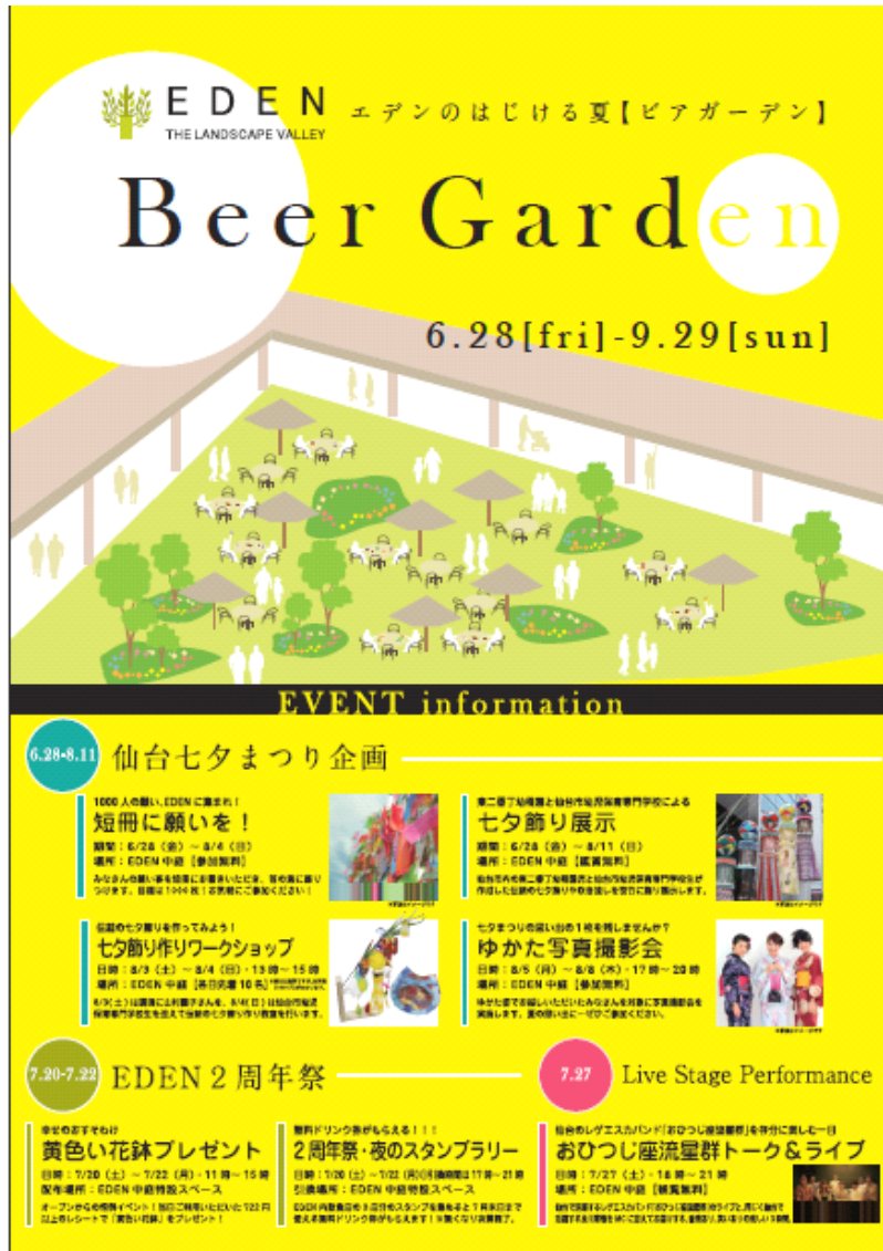
「EDEN Beer Garden」チラシ（『EDEN』飲食店頭にて配布）

※この照明は太陽光により発電するタイプのみを採用しており、環境にも配慮しております。