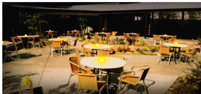
「EDEN Beer Garden」中庭ライトアップイメージ