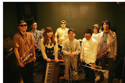
「おひつじ座流星群」

主な内容：地元で人気の「おひつじ座流星群」のトーク&ライブ（7月27日・8月17日開催予定）をはじめ、仙台で活躍するプロ、高等学校、ボーカルの生徒が生演奏会(発表会)を行います。