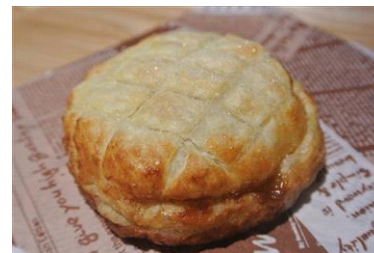
カメのコウラパイ

アオウミガメの特別展示に合わせて、ウミガメの甲羅の形をしたアップルパイ、その名も「カメのコウラパイ」を期間限定・数量限定で販売します。リンゴをカメの甲羅にちなみコーラで煮詰め、味に深みをだしました。すみだ水族館で焼き上げた、かわいい焼きたてパイをお楽しみください。