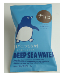
チョコアイスもなか