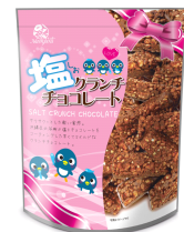
塩クランチチョコ