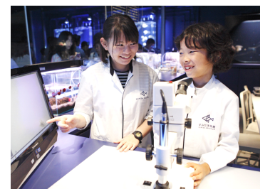
キッズ研究员イメージ

内容：クラゲに餌をあげたり、水槽の水を換えたりといった飼育体験を通じてクラゲの生態を理解し、生き物への興味を高めていただくプログラムです。アクアラボで実際に飼育スタッフと一緒にクラゲの研究をします。