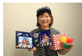
初笑いくじのイメージ

1ポーズを撮影されたお客さまは、3分の2の確率で金券が当たるくじを引くことができます。