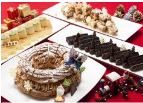
＜クリスマス限定＞ペストリーシェフの手作りスイーツ