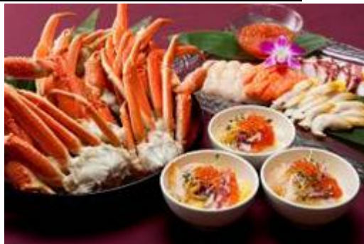
ズワイ蟹や海鮮丼