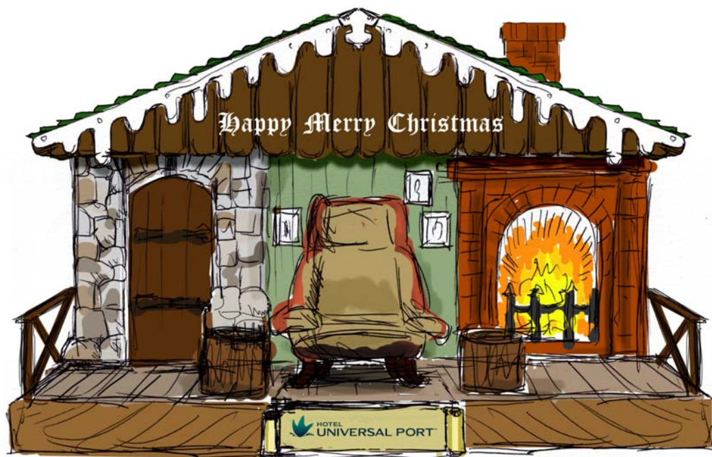
サンタのログハウスイメージ