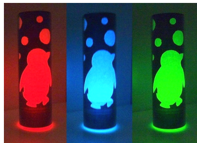
7色のLEDライトが光る仕掛け 「ゆらゆらいろいろ♪ペンギンランプ」

環境にやさしい無公害プラスチックのPET板を使用したシェードランプが、ペンギンシルエットの優しい光でクリスマスの素敵な夜を演出してくれること間違いなしです。