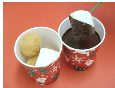
寒いクリスマスにはあったかいデザートで 「あったか！マシューチョコ」