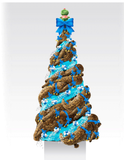
オオサンショウウオが川を上る様子をイメージした『オオサンショウウオぬいぐるみツリー』イメージ

「京の川ゾーン」で展示しているオオサンショウウオをモチーフにしたぬいぐるみ。手触りもよく京都水族館のお土産としても大人気です。そのオオサンショウウオぬいぐるみを100個装飾した「オオサンショウウオぬいぐるみツリー」は、なんと高さ2.4メートル。水の流れるとオオサンショウウオが川を上っていく様子をイメージしています。1階ミュージアムショップ内に設置します。