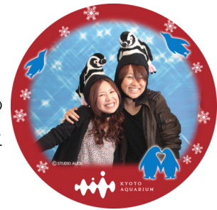
シーズンごとにデザインが変わる 「すいぞく缶バッジ(冬バージョン)」

京都水族館に来た思い出を最高の表情でカタチにできる「スタジオアリスのフォトコーナー」。写真撮影で使ったデータを使った『京都水族館』オリジナルの缶バッジ「すいぞく缶バッジ」が、ペンギンと雪の結晶をデザインし冬バージョンで登場します。プロのカメラマンが撮影した記念写真の画像データが、世界にたった1つしか存在しないオリジナルの缶バッジに大変身します。