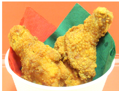
ピリっとした山椒の風味が癖になるおいしさ 「京山椒風味フライドチキン」