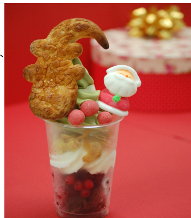
オオサンショウウオ型のサクサクパイがインパクト大 「オオサンショウウオツリーパフェ」