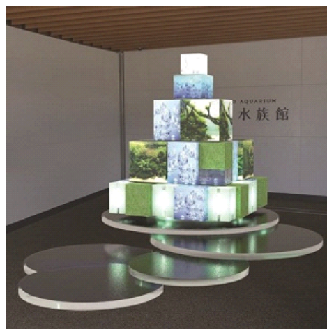
“水”と“いのち”のつながりを表現した『LIFE TREE』イメージ