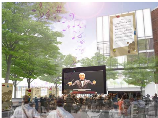
※パースはイメージです