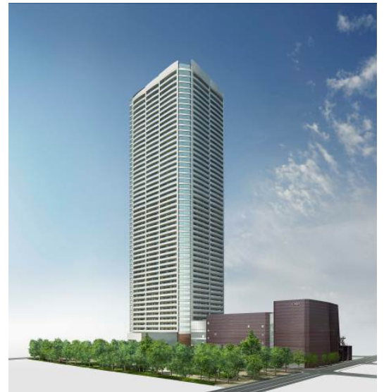
完成外観イメージ

名 称 :大阪ひびきの街 ザ・サンクタスタワー 所 在 地 :大阪市西区新町一丁目1番19の一部(地番) 住 戸 数 :888戸 階 数 :地上53階・地下1階・塔屋3階 高 さ :189.55m(最高部の高さ) 構 造 :鉄筋コンクリート造(一部鉄骨造) 間 取 り :1LDK~4LDK 住居専有面積 :38.30㎡~156.71㎡ 敷 地 面 積 :4,297.04㎡ 建 築 面 積 :2,669.12㎡ 建 築 延 床 面 積 :99,754.22㎡ 竣 工 予 定 :2015年9月中旬 入 居 予 定 :2015年12月中旬 販 売 予 定 :2012年9月中旬 販 売 価 格 :未定 設 計 ・ 監 理 :株式会社大林組 大阪本店 一級建築士事務所 施 工 :株式会社大林組 事 業 者 :オリックス不動産株式会社 株式会社大京 京阪電鉄不動産株式会社 大和ハウス工業株式会社 株式会社アーバネックス