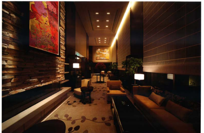
レセプションハウスでも体感できる「ザ・レセプション」(左)と「ザ・リビング」(右)