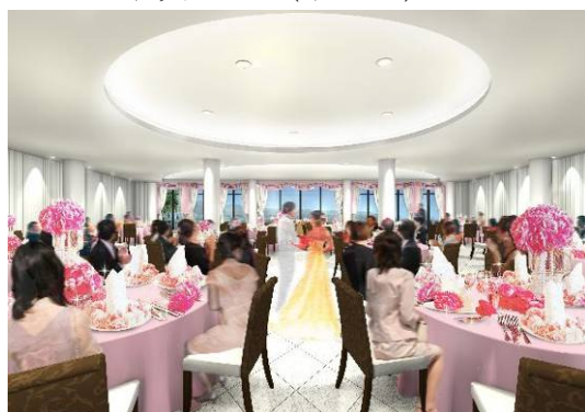
1F バンケットルーム(イメージ)